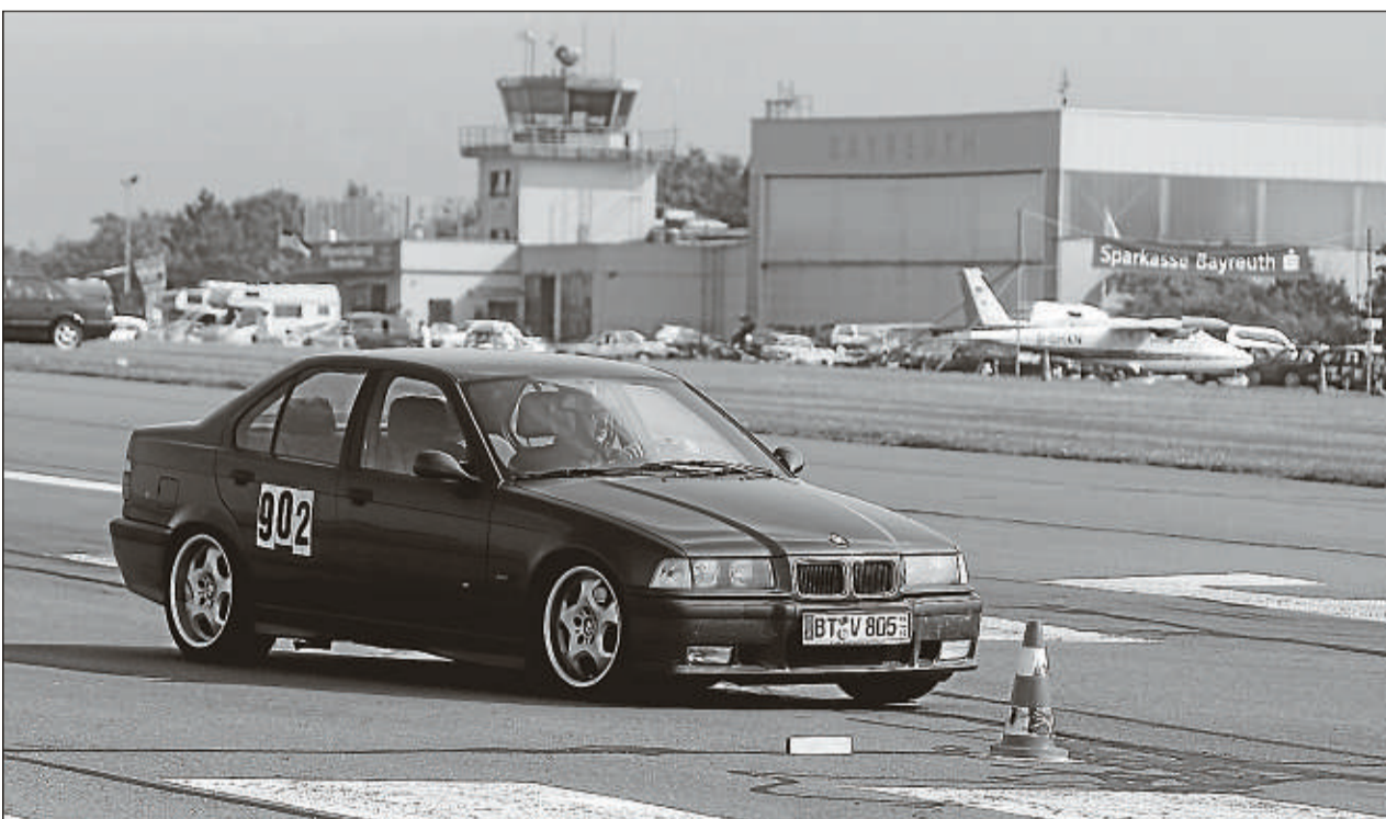
Zu den erfolgreichsten Vertretern des MSC Sophienthal gehörte Jochen Hacker. Er steuerte seinen BMW in der Klasse der Serienwagen über 2000 ccm auf den dritten Platz.

Aufsteiger TSV Crailsheim sowie ETB Essen und USC Heidelberg könnten ebenfalls vor einem schwierigen Kampf um den Klassenerhalt stehen.